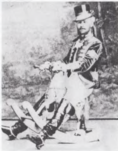
Cimrmanovi pacienti ing. Luskač a dr. Plížil. První trpěl fixní ideou panského kočího, druhý jízdního kurýra. Jára Cimrman je vyléčil svým psychodramatickým textem „Koblihy“.