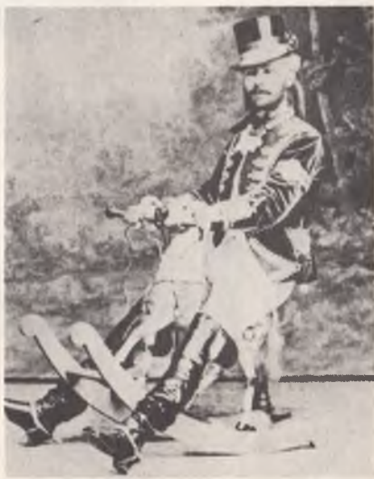
Cimrmanovi pacienti ing. Luskač a dr. Plížil. První trpěl fixní ideou panského kočáho, druhý jízdního kurýra. Jára Cimrman je vyléčil svým psychodramatickým textem „Koblihy“.