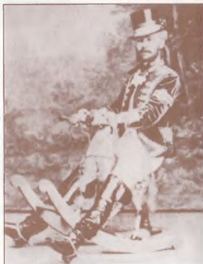
Cimrmanovi pacienti ing. Luskač a dr. Plížil. První trpěl fixní ideou panského kočího, druhý jízdního kurýra. Jára Cimrman je vyléčil svým psychodramatickým textem „Koblihy“.